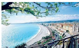
LA PROMENADE DES ANGLAIS