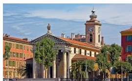
L'EGLISE NOTRE DAME DU PORT