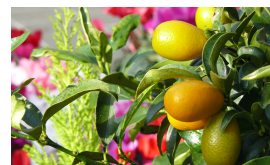
LE MARCHÉ AUX FLEURS